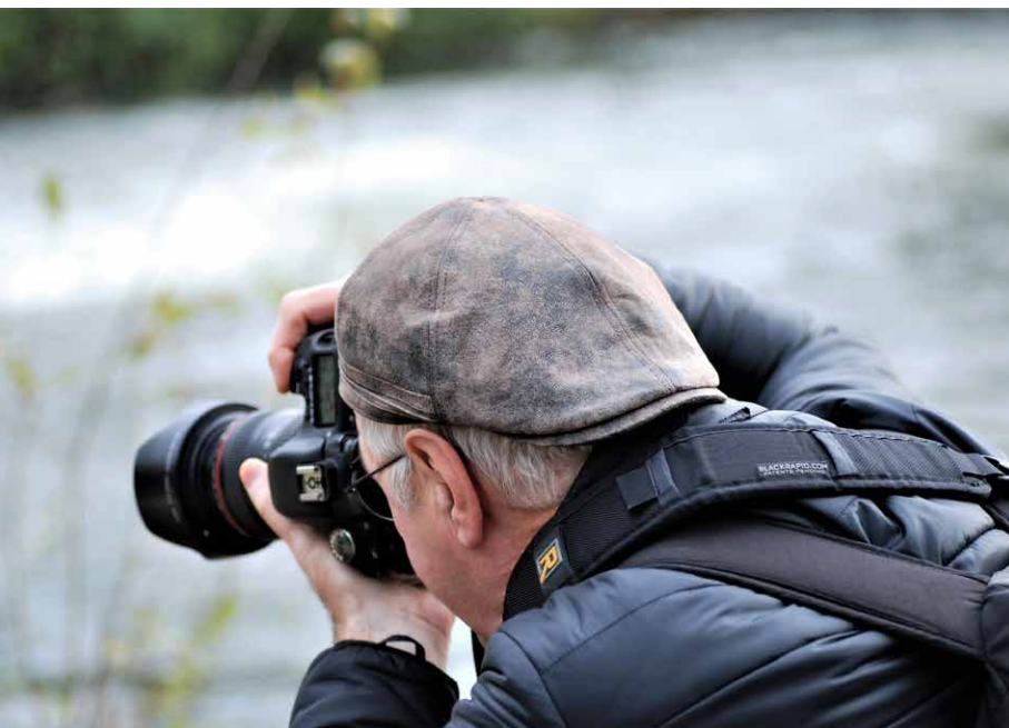
Photo-vidéo du Loir